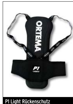
P1 Light Rückenschutz