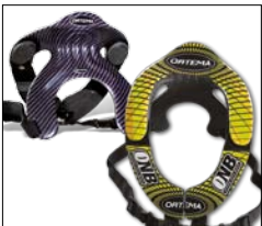
ONB Neckbrace + Dekor Set gelb