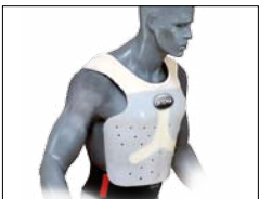
Brust- und Schlüsselbeinprotektor