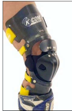
K-COM Knieorthese Carbonfaser

Die K-COM Knieorthese wird (ohne Mehrpreis) nach einem Gipsabdruck individuell gefertigt. Sie gibt dem Kniegelenk optimalen Schutz und Halt und ist dank der optimierten Konstruktion auch unter Lederkombis gut zu tragen.