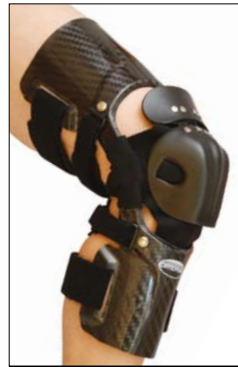
V8-PRO aus Spezial-Carbon

Knieorthesen in Carbonfaserbauweise, nach Gipsabdruck gefertigt, sind ein High-End-Produkt, das bevorzugt von Profis eingesetzt wird.