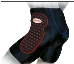
X-Pants LP Hüftprotektoren Hose