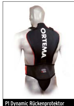
P1 Dynamic Rückenprotektor