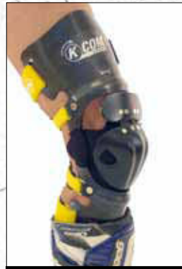
K-COM Knieorthese Carbonfaser

Die K-COM Knieorthese wird (ohne Mehrpreis) nach einem Gipsabdruck individuell gefertigt. Sie gibt dem Kniegelenk optimalen Schutz und Halt und ist dank der optimierten Konstruktion auch unter Lederkombis gut zu tragen.