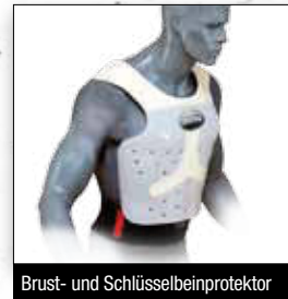
Brust- und Schlüsselbeinprotector