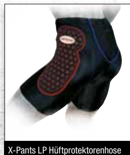
X-Pants LP Hüftprotektorenhose