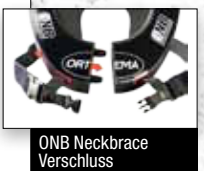
ONB Neckbrace Verschluss